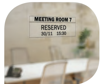
ฉลากป้ายภายในสำนักงาน