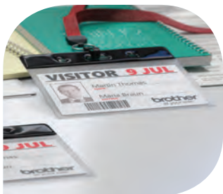
ฉลากติดบัตรผู้มาเยือน