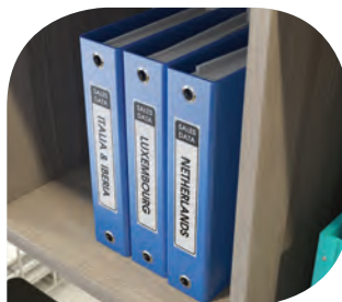
ฉลากติดแฟ้มจัดเก็บเอกสาร