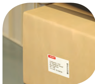
ฉลากเพื่อการขนส่ง