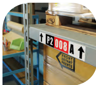
ฉลากป้ายชั่วคราว