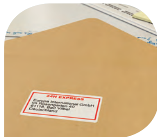
ฉลากไปรษณีย์