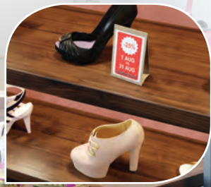
ป้ายโปรโมชั่น