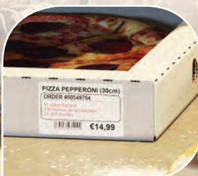
ส่งชื้อกลับบ้าน

ร้านค้าประเภทส่งชื้อกลับบ้านสามารถพิมพ์รายละเอียดของคำสั่งซื้อ รวมถึงข้อมูลที่อยู่สำหรับจัดส่งด้วย