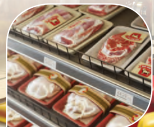
การติดฉลากที่ขอบของชั้นวาง