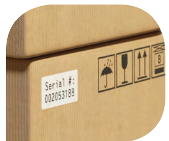
ฉลากบรรจุภัณฑ์ผลิตภัณฑ์ต่างๆ