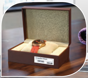
ฉลากราคา/บาร์โค้ด