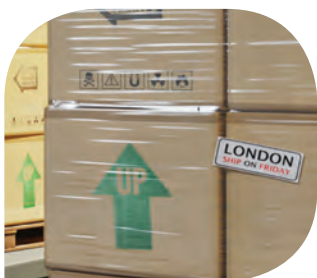
ฉลากระบุการใช้งาน