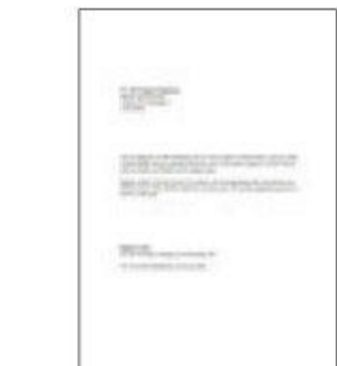
#1 ข้อความสีดำ

*1 ความเร็วการพิมพ์ (หน้าต่อนาที) คำนวณจากการพิมพ์บนกระดาษธรรมดา A4 ในโหมดที่เร็วที่สุด ความเร็วในการพิมพ์อาจแตกต่างกันไปขึ้นอยู่กับข้อกำหนดของระบบ, โหมดการพิมพ์, ความชื้นของกระดาษ, ซอฟต์แวร์, ประเภทของกระดาษที่ใช้ และการเชื่อมต่อ ความเร็วในการพิมพ์โดยรวมเวลาประมวลผลของคอมพิวเตอร์เครื่องที่ส่งพิมพ์